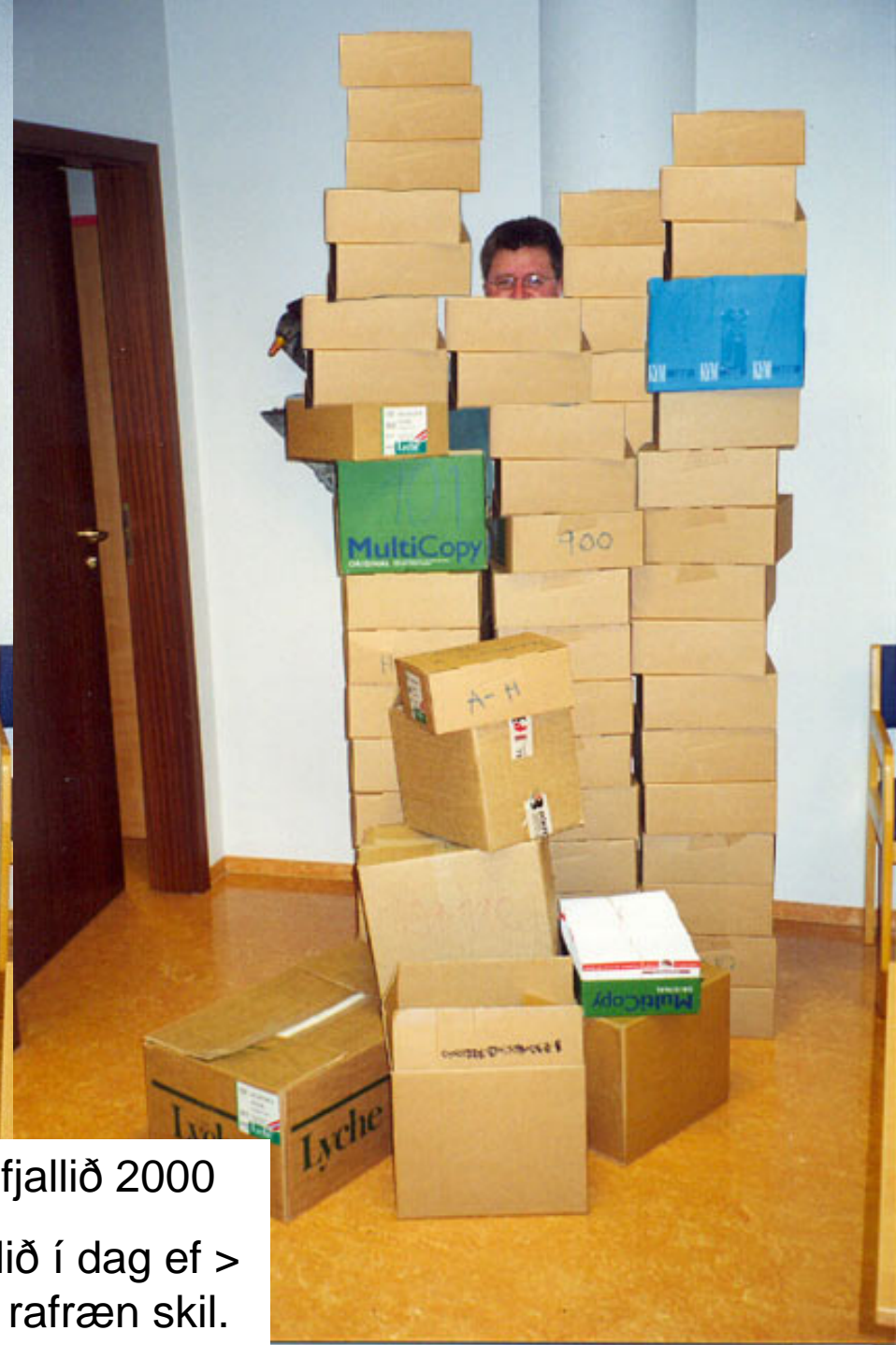
< Skýrslufjallið 2000 Skýrslufjallið í dag ef > ekki væru rafræn skil.