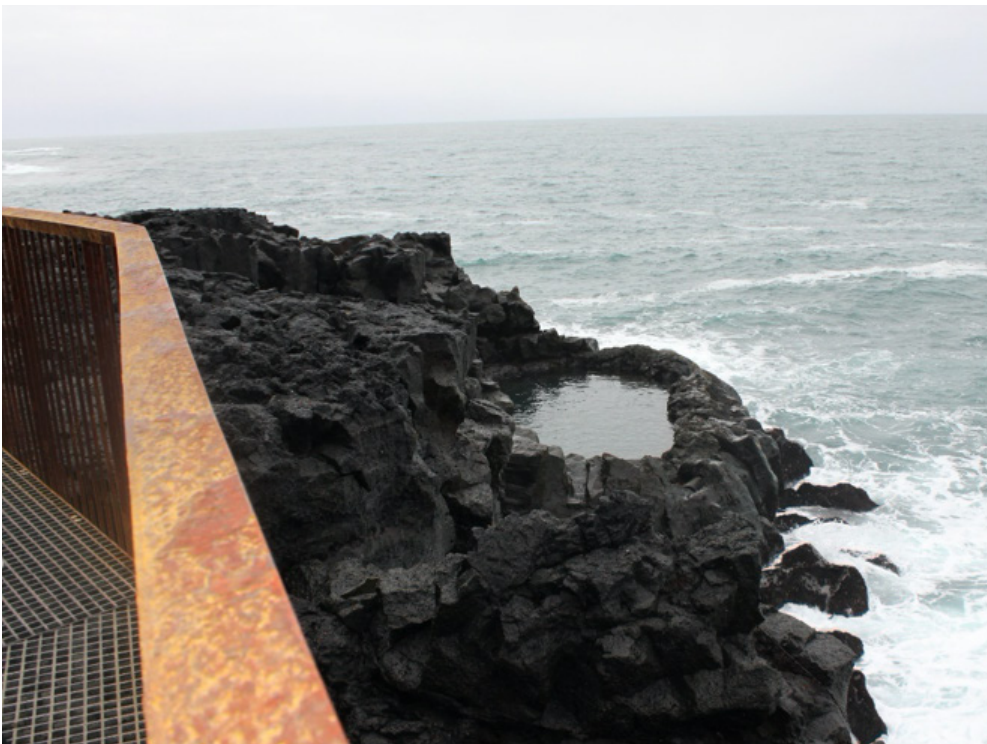
Mynd 12: Brimketill. Útsýnispallur, bílastæði og stígar. Styrkur veittur 2016.