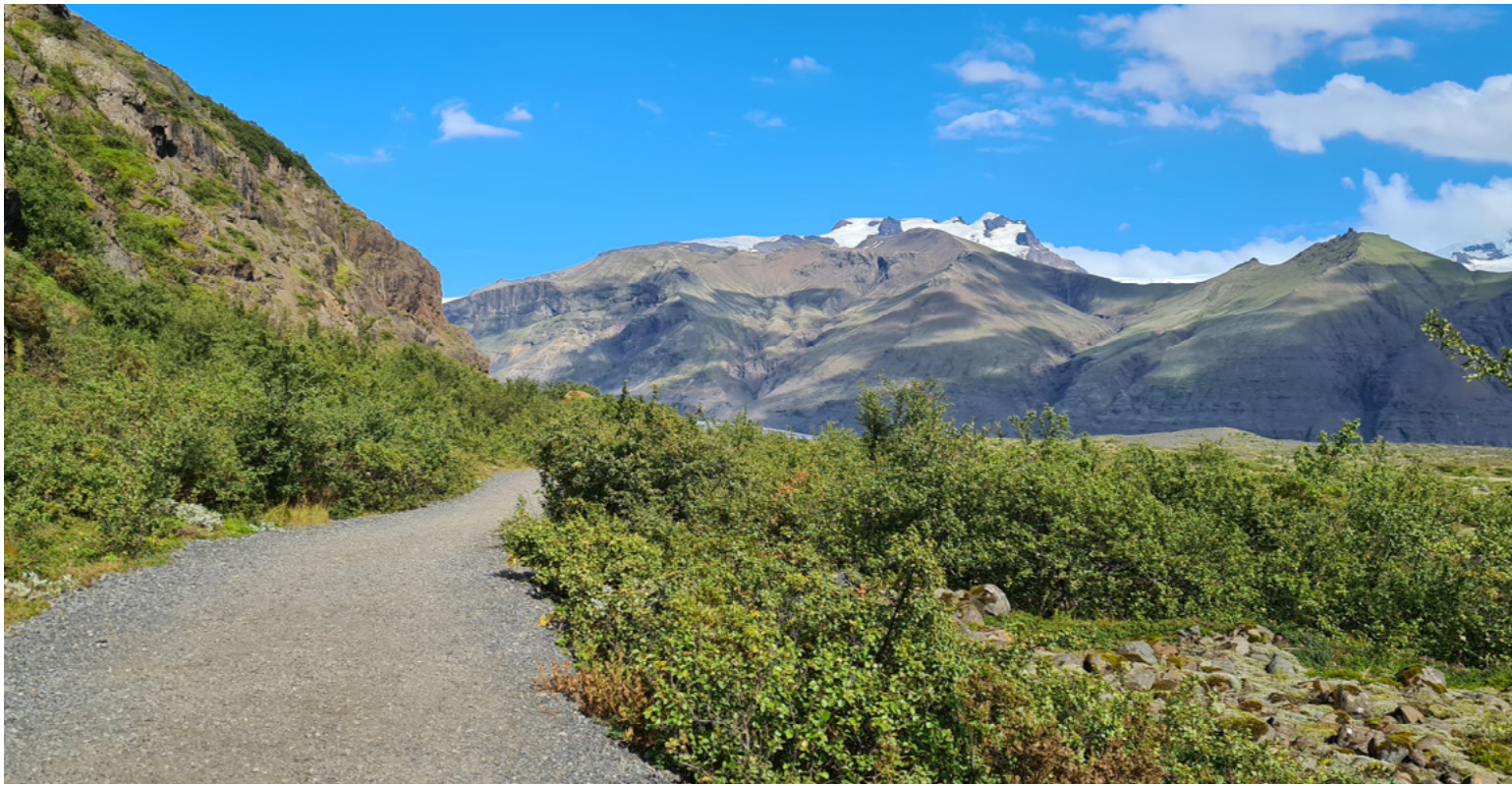
Mynd 17: Skaftafell. Gönguleiðir, bílastæði, þjónustuhús og útsýnispallar. Styrkir veittir 2013-2016.

á leiðbeiningum og mögulega sáttaumleitunum, en nauðsynlegar og mikilvægar framkvæmdir mega ekki líða fyrir óeiningu eða þekkingarskort.