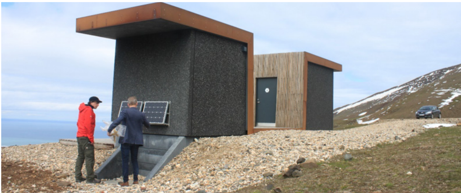
Mynd 9: Stórurð – Dyrfjöll. Þjónustuhús, endurbætur á gönguleiðum, merkingum og upplýsingagjöf. Styrkir veittir 2014-2016.

Samkvæmt gildandi reglugerð um sjóðinn greiðist styrkur að jafnaði út til styrkþega í samræmi við samþykka kostnaðar-, verk- og framkvæmdaáætlun þegar verkefni er lokið og lokaskýrsla hefur verið samþykkt. Styrkþega er þó heimilt að skila inn framvinduskýrslu sem lýsir a.m.k. hálfnuðu verki og fást, við samþykkt hennar, greidd 40% af styrkfjárhæðinni. Þá hefur nokkuð verið um að styrkjum sé skilað aftur í sjóðinn þar sem framkvæmdir hafa ekki náð að fara af stað. Það sem af er starfstíma sjóðsins frá fyrstu úthlutun árið 2012 hafa verið greiddir út um fjórir milljarðar kr., rúmlega 290 milljónum kr. hefur verið skilað aftur og stendur því eftir í kringum einn og hálfur milljarður kr. sem eftir er að greiða út miðað við síðustu úthlutun, eins og sjá má í töflu 3. Þetta stafar m.a. af því að lokaskýrslu hefur ekki verið skilað eða verkefni hafa reynst ódýrari en lagt var upp með.