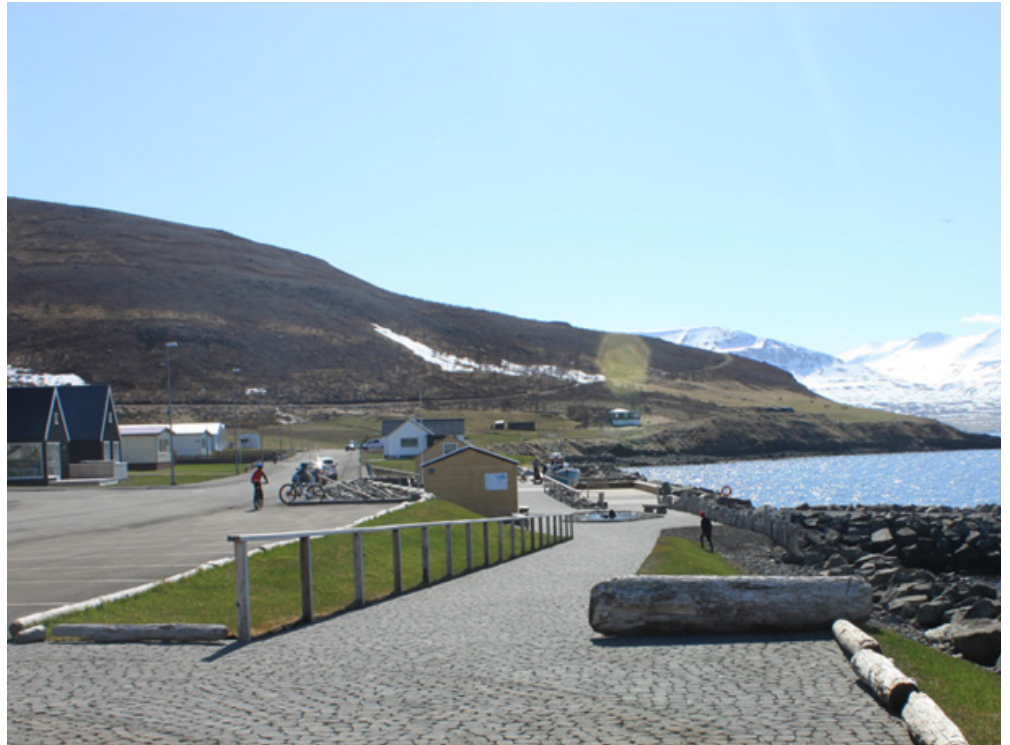
Mynd 11: Þar sem vegurinn endar. Áningarstaður þ.m.t. bílastæði, snyrtingar, bekkir og útsýnisskrifa. Styrkur veittur 2017.