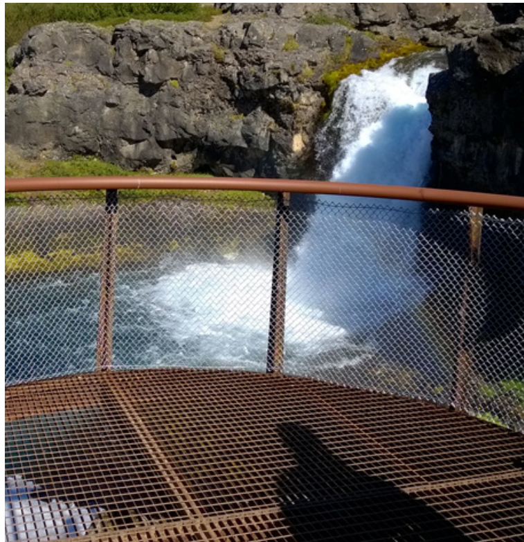
Mynd 3 og 4: Dynjandi. Göngustígar, útsýnispallar, rotþrö, salernishús og bílastæði. Styrkir veittir 2014-2018.

Í töflu 1 má sjá skiptingu styrkja eftir flokkum. Rúmlega 320 styrkir hafa verið veittir til uppbyggingar ferðamannastaða eða um 3,6 ma.kr. Styrkjunum hefur verið varið í að byggja upp ferðamannastaði þar sem ráðist hefur verið í gerð ýmissa innviða eins og salerna, skilta, göngustíga og útsýnispalla. Þá hafa tæplega 300 styrkir verið veittir til verkefna í þágu náttúruverndar og öryggis eða um 1,6 ma.kr. Styrkirnir hafa að mestu leyti farið í að lagfæra náttúruskemmdir og auka öryggi. Við styrkveitingu hefur einnig verið hugað að mikilvægi hönnunar og skipulagningar staðanna og hafa ríflega 100 styrkir verið veittir í þann lið eða sem nemur rúmum 350 m.kr. Þeir styrkir eru oft undanfari þess að umsækjandi sækir um styrk til framkvæmda.