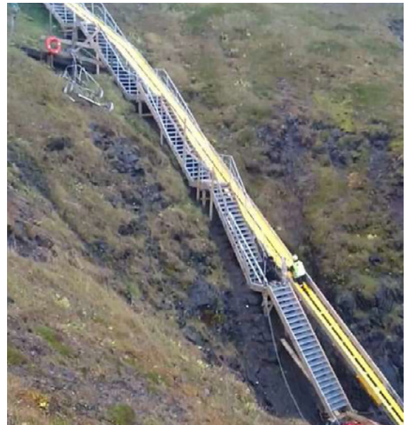
Mynd 1 og 2: Hornbjargsviti. Stigi, togbraut, vetrarsalerni og lagfæringar á fallþípu og gangráð. Styrkur veittur 2019.