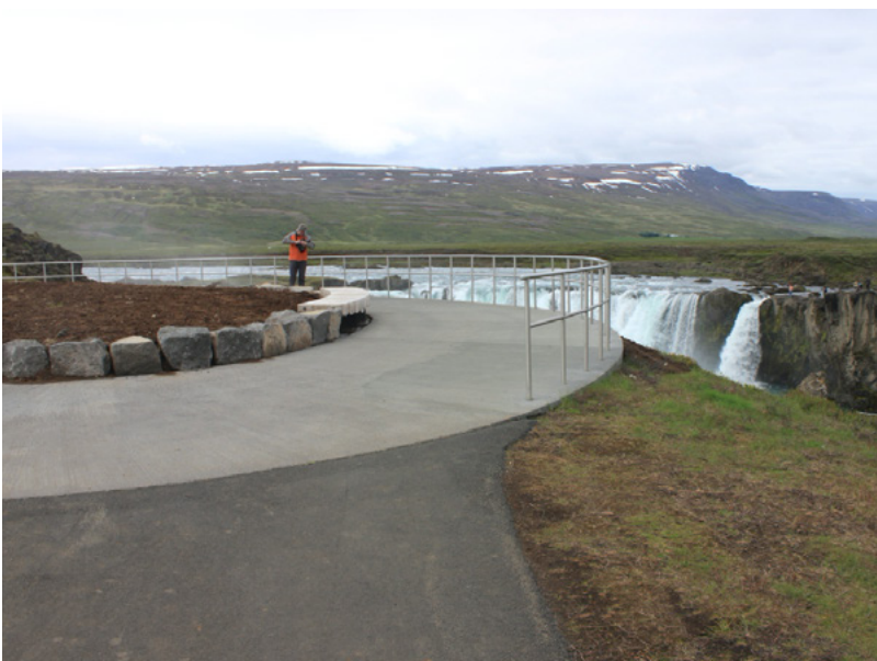
Mynd 5, 6 og 7: Goðafoss. Staðan austan megin 2012. Göngustígur austan megin 2017. Útsýnispallur austan megin 2017. Styrkir veittir í ýmsar framkvæmdir þ.m.t. í bílastæði, göngustíga og palla 2013-2019.