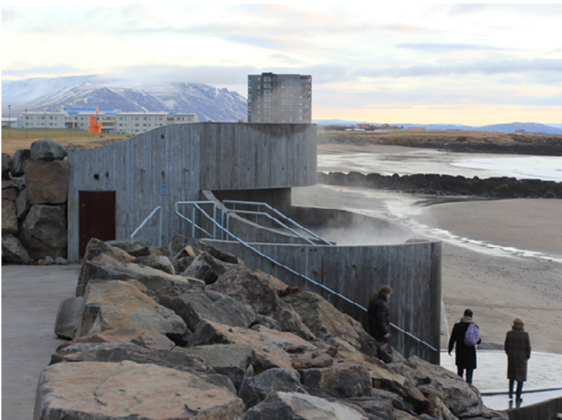
Mynd 13 og 14: Guðlaug. Útsýnispallur og heit laug. Styrkur veittur 2017.