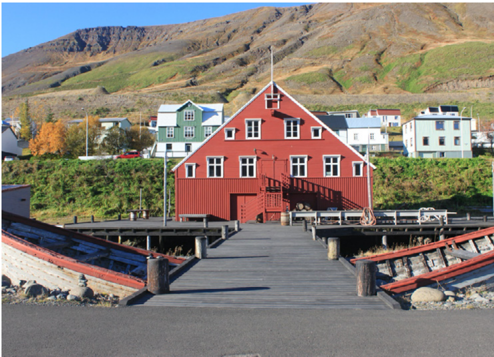
Mynd 15 og 16: Síldarminjasafn Íslands. Lokafrágangur á lóð þ.m.t. bryggjumíði, smíði göngupalla og bætt lýsing. Styrkur veittur 2013.