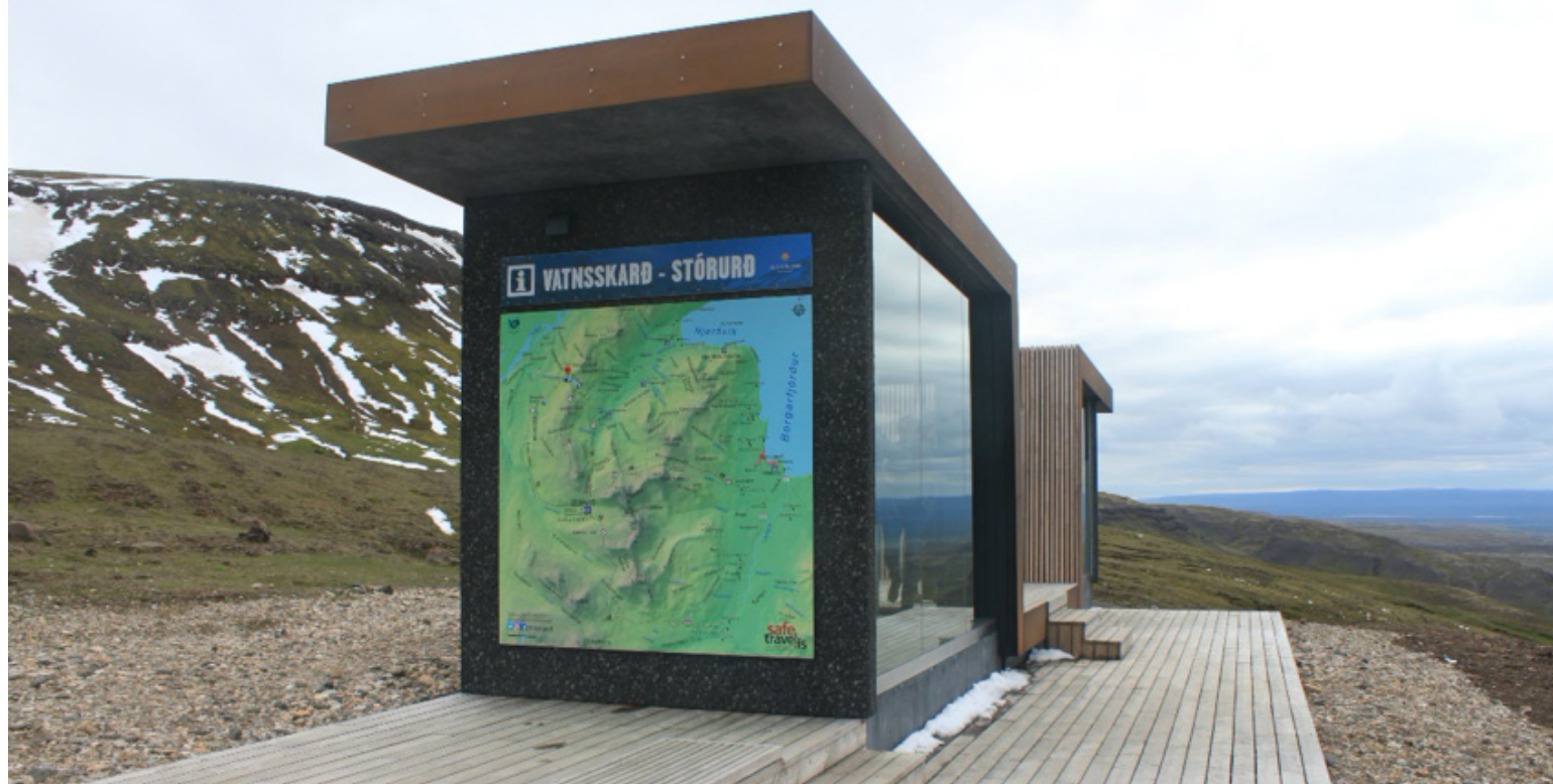
Mynd 10: Stórurð – Dyrffjöll. Þjónustuhús, endurbættur á gönguleiðum, merkingum og upplýsingagjöf. Styrkir veittir 2014-2016.