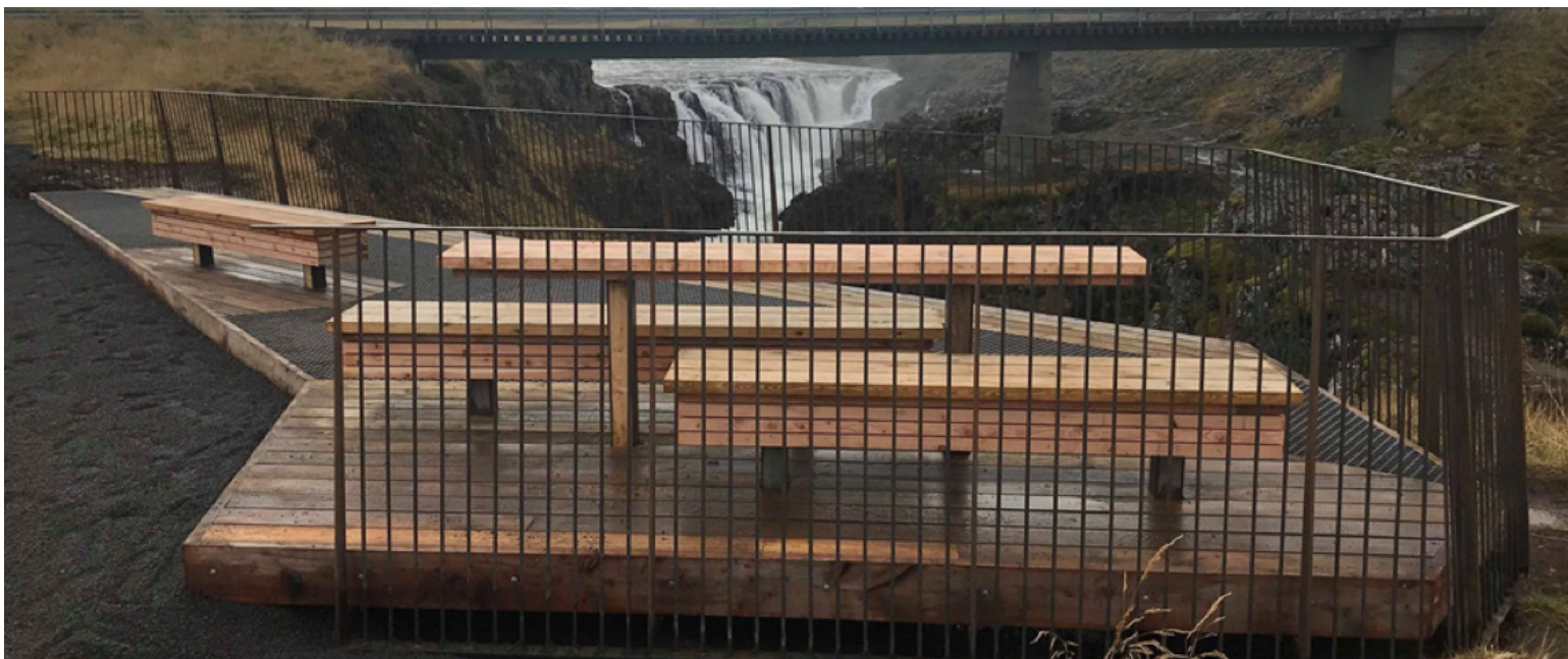
Mynd 18: Kolugljúfur. Útsýnispallur. Styrkur veittur 2017.

Þau verkefni sem Framkvæmdasjóður ferðamannastaða hefur styrkt undanfarin ár hafa verið að frumkvæði heimamanna þar sem landeigandi eða sveitarfélag hefur gengið fram fyrir skjöldu og undirbúið framkvæmdir. Allt er varðar samræmingu og undirbúningsvinnu hefur verið á hendi þeirra aðila. Slíku frumkvæði er hins vegar ekki alltaf til að dreifa en aðstæður kalla samt á framkvæmdir. Í þeim tilvikum getur verið þörf á leiðbeiningum og jafnvel beinni aðkomu utanaðkomandi aðila til að stuðla að framgangi verkefna í samvinnu við heimamenn. Með öflugra stoðkerfi ferðaþjónustunnar, m.a. með tilkomu áfangastaðastofa, gæti opnast farvegur fyrir slíkt viðbragð. Ferðamálastofa gæti í þeim tilvikum aðstoðað við undirbúning mála til hagsbóta fyrir náttúruvernd og öryggi ferðamanna.